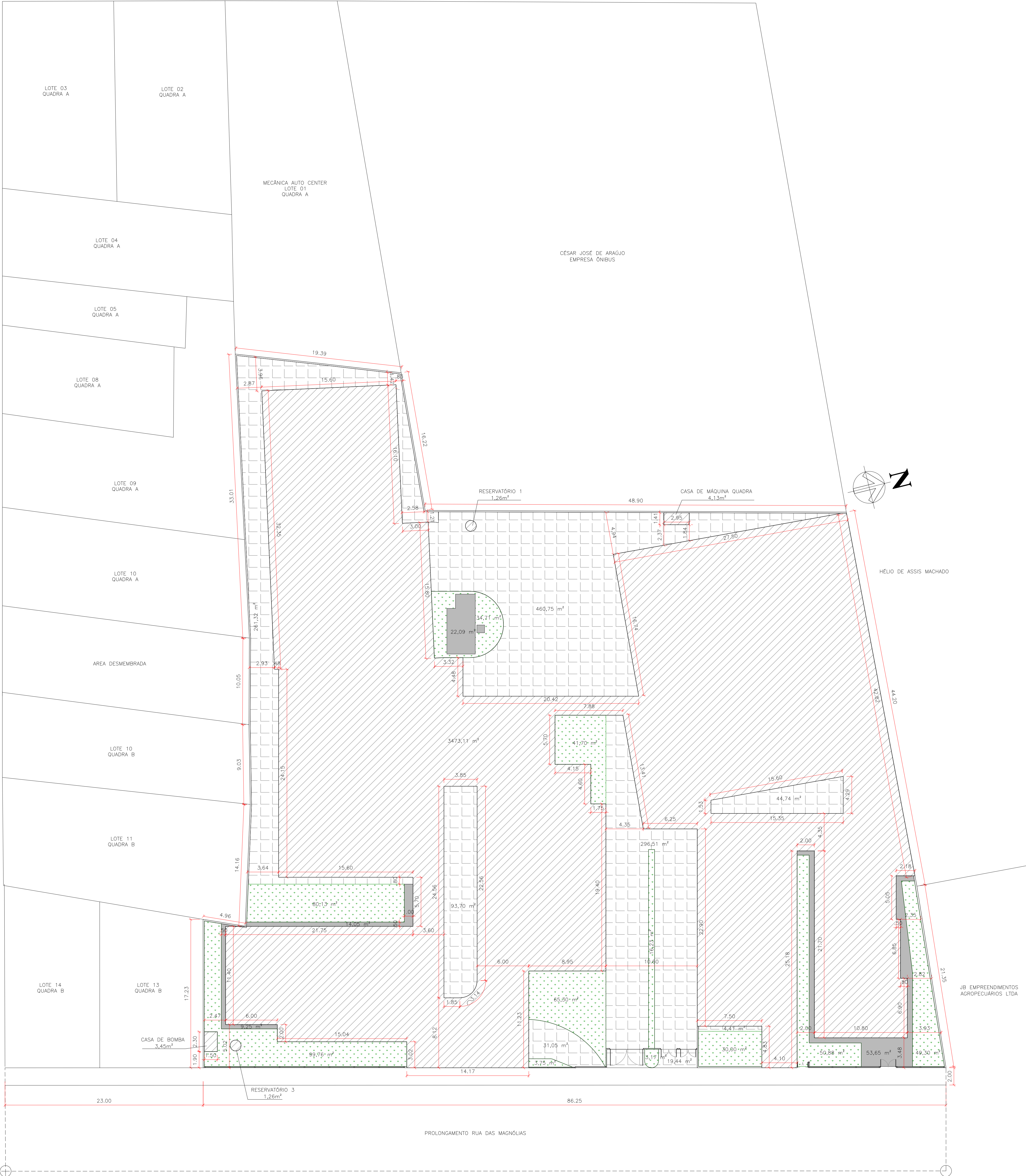
PLANTA IMPLANTAÇÃO / SITUAÇÃO ESC 1/200

HEMA INCORPORADORA E EMPREENDIMENTOS IMOBILIÁRIOS LTDA